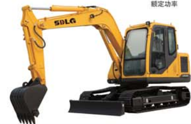
LG685 整机操作重量 8200kg 铲斗标准容量 0.32m 3 额定功率 53.1KW