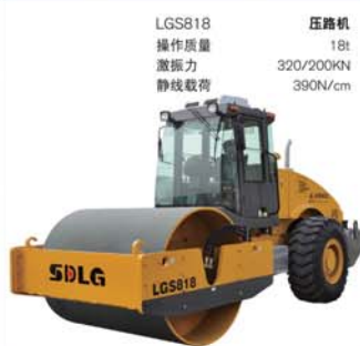
LGS818 压路机 操作质量 18t 激振力 320/200KN 静线载荷 390N/cm