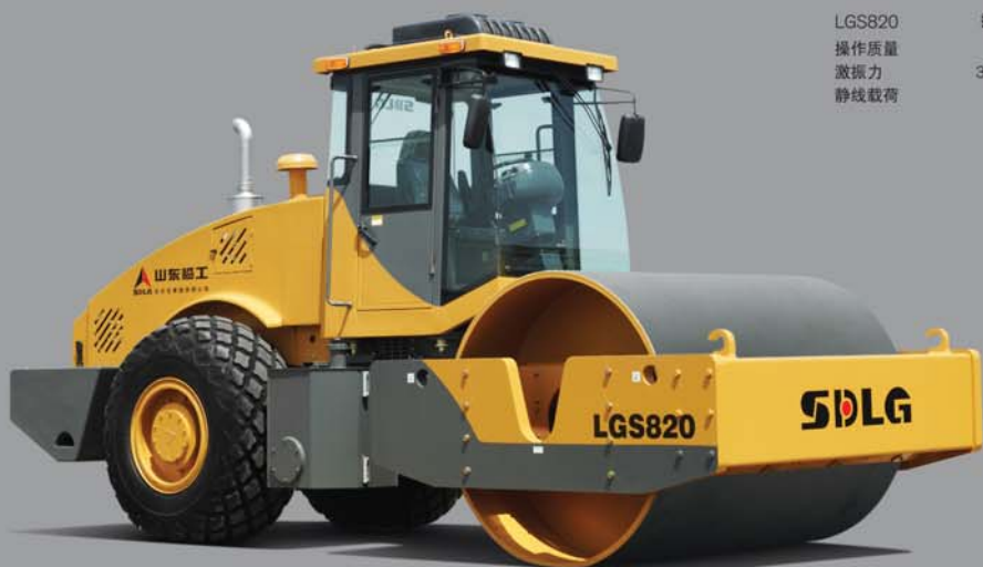
LGS820 振动压路机 操作质量 20t 激振力 360/280KN 静线载荷 455N/cm