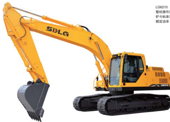
LG6210 整机操作重量 21700kg 铲斗标准容量 1.0m 3 额定功率 120KW