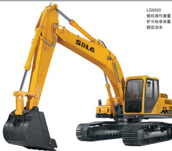
LG6220 整机操作重量 21800kg 铲斗标准容量 0.92m 3 额定功率 125KW