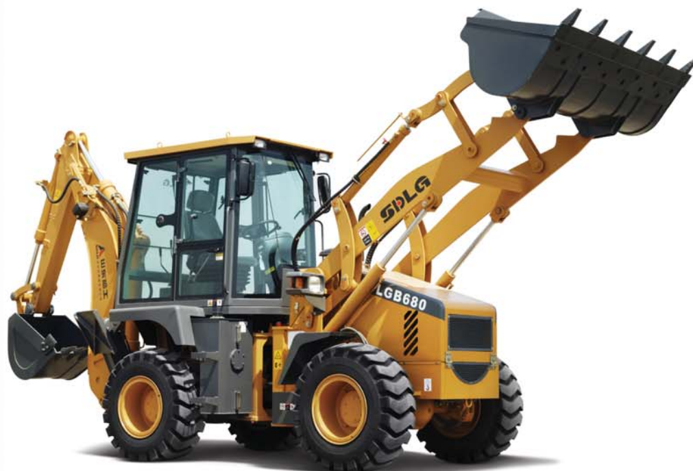
LGB680 挖掘装载机 操作质量 8.3t 铲斗容量 装载装置 1m 3 挖掘装置 0.3m 3