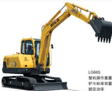
LG665 整机操作重量 6200kg 铲斗标准容量 0.22m 3 额定功率 35.5KW