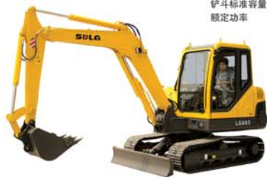
LG660 整机操作重量 5800kg 铲斗标准容量 0.2m 3 额定功率 35.5KW