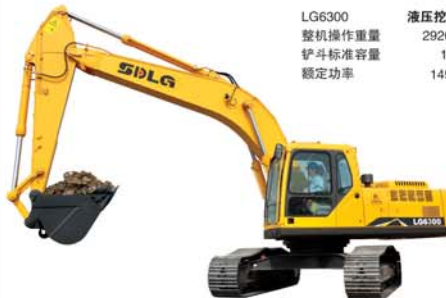
LG6300 整机操作重量 29200kg 铲斗标准容量 1.3m 3 额定功率 149KW