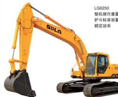
LG6250 整机操作重量 24300kg 铲斗标准容量 1.2m 3 额定功率 134KW