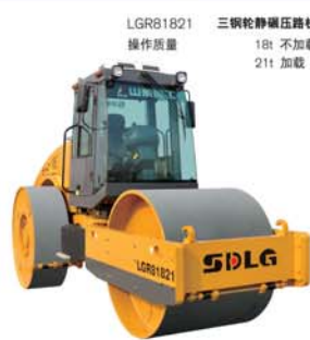
LGR81821 三钢轮静碾压路机 操作质量 18t 不加载 21t 加载