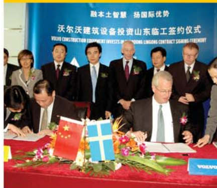
临工与沃尔沃签约