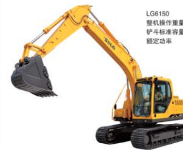
LG6150 整机操作重量 13800kg 铲斗标准容量 0.52m 3 额定功率 69KW