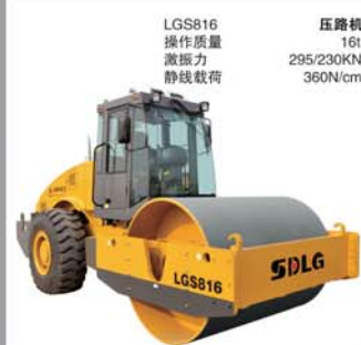
LGS816 压路机 操作质量 16t 激振力 295/230KN 静线载荷 360N/cm